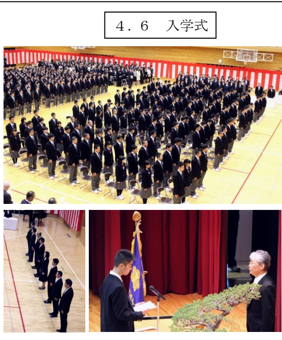
4. 6 入学式

四月六日、入学式が行われました。新入生のみなさん、入学おめでとうございます。新入生の大曲工業高校では、環境の整った実習棟があり、進路実現に向けた専門的な学習に励むことができる上、資格取得にも力を入れています。