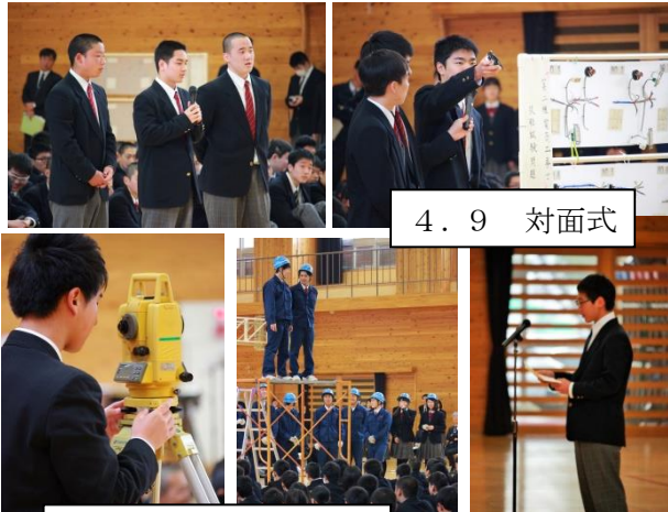
4. 9 対面式