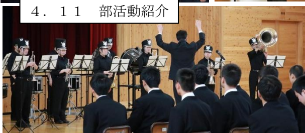
4. 11 部活動紹介

また課外活動も盛んで、数々の好成績を残しています。生徒全員が輝きの場を持つ学校です。大生の一員として、私達と一緒に、日々の成長を実感しながら、共に躍進していきましょう。