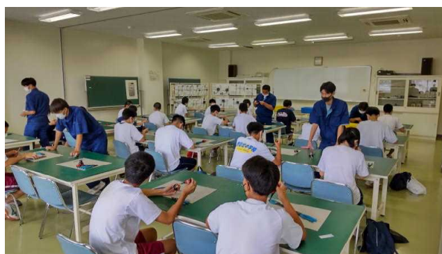
電気科体験実習（電気工事実技）