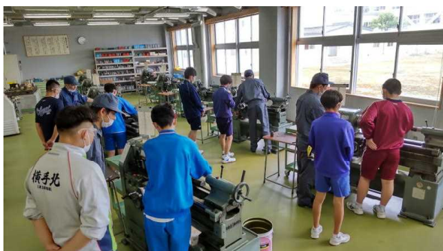
機械科体験実習（旋盤）