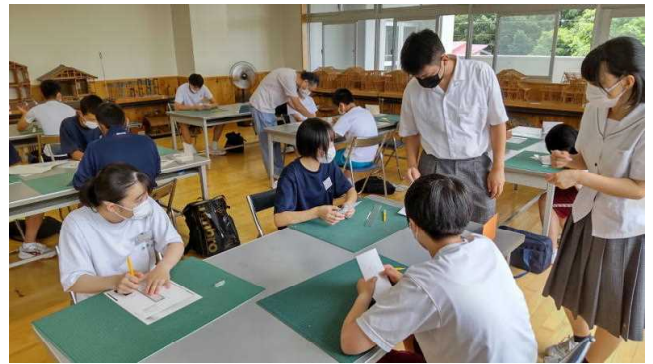
建築コース体験実習（折り紙建築）