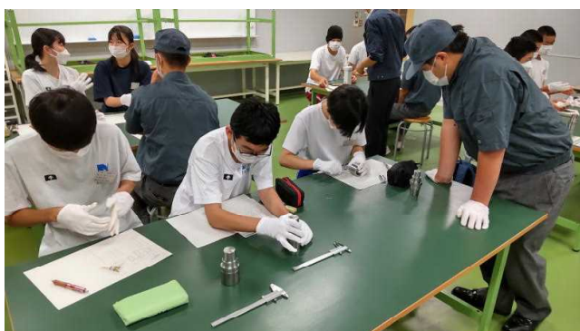
機械科体験実習（測定の基礎）