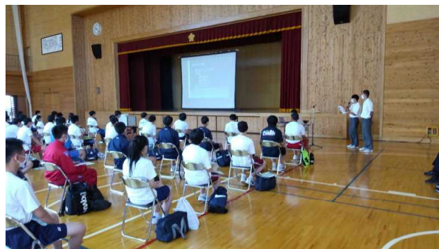
生徒による学科・コース紹介