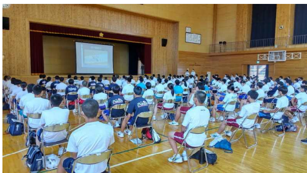
生徒による学科・コース紹介