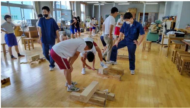
建築コース体験実習（木材加工）