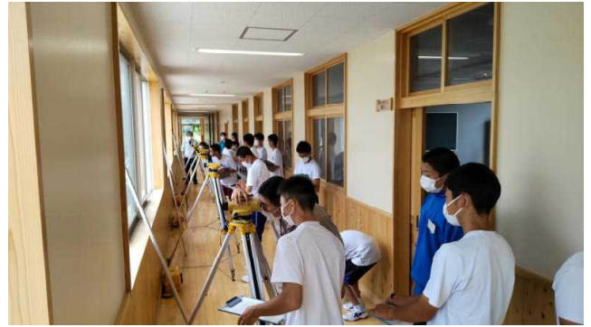
土木コース体験実習（測量体験）