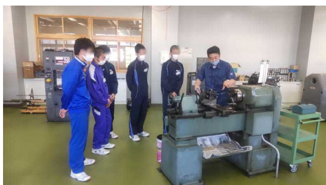
機械科体験実習（旋盤）