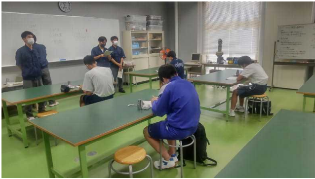
機械科体験実習（測定の基礎）