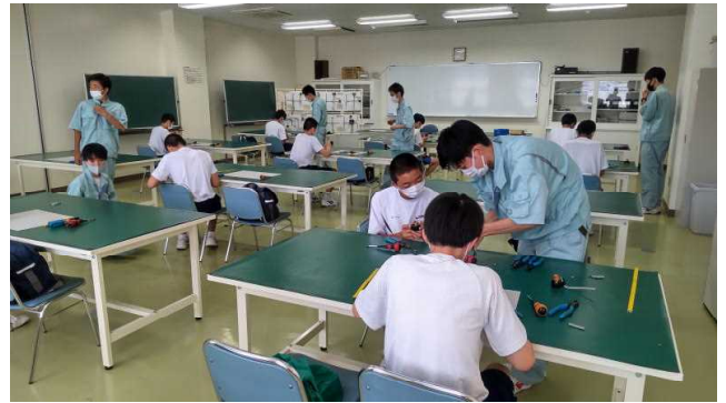
電気科体験実習（電気工事実技）