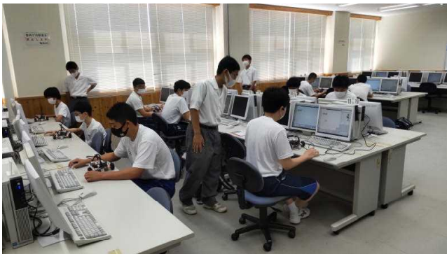
電気科体験実習（ロボット・プログラミング）