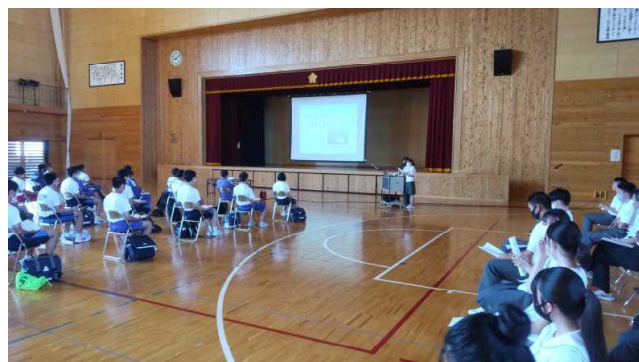
生徒による学科・コース紹介