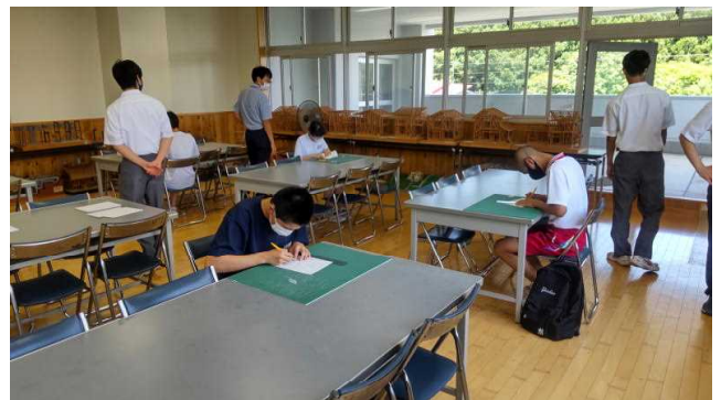
建築コース体験実習（折り紙建築）