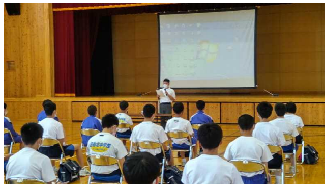
生徒会長による学校紹介