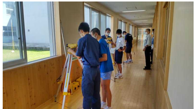
土木コース体験実習（測量体験）