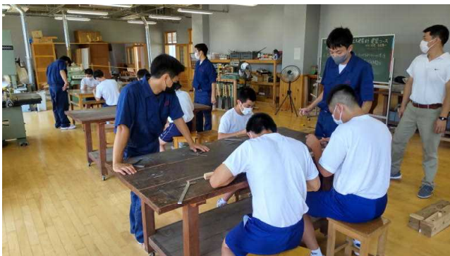
建築コース体験実習（木材加工）